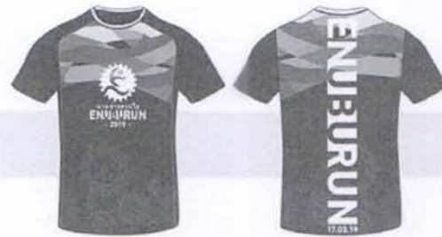
แบบเสื้อวิ่ง