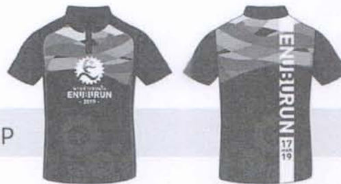
แบบเสื้อวิ่ง VIP